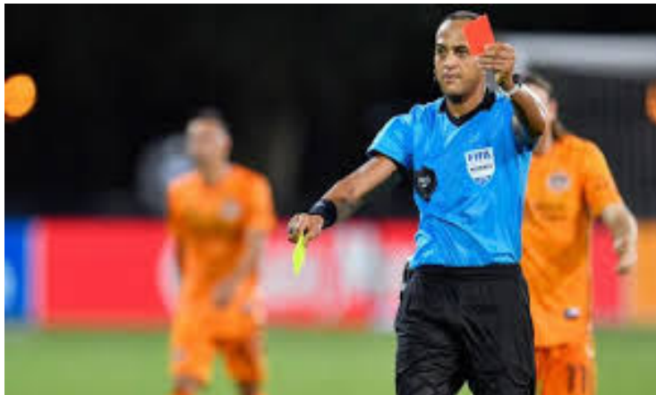
Dal giallo al rosso: un Governo fallosso e fallimentare